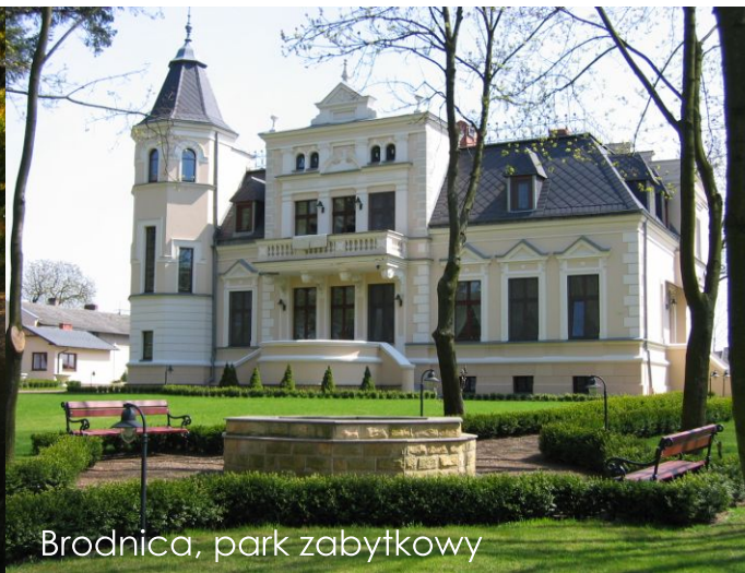
Brodnica, park zabytkowy