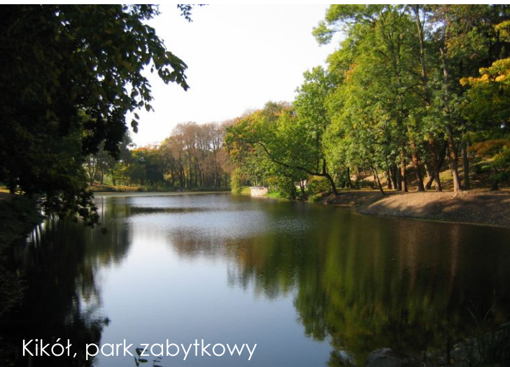
Kikół, park zabytkowy